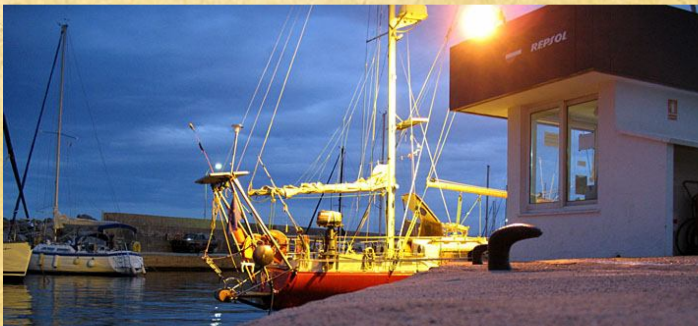
Princezna u benzínové pumpy v Palmě.